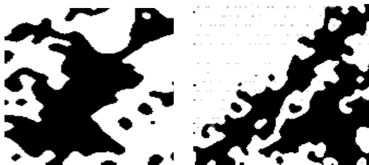
Рис. 1 – Изображение поровой среды шлифов осадка

На рис. 1 представлены подвергнутые специальной компьютерной обработке (сканирование) фотографии шлифов осадка кека флотоконцентрата. На рисунке видны поры (расширения в поровой сети) и горловины пор, соединяющие отдельные расширения (щелевидные каналы). Поры и каналы выделены на поверхности шлифа черным цветом.